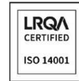
Norma ISO 14001 - Medio ambiente -

Además, el Sistema Integrado de Gestión (SIG) de Menarini asegura el cumplimiento estricto de la normativa ambiental en todas las áreas de su actividad.